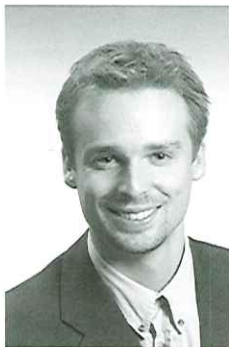
Af Henrik Schulz, Java House