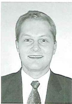
Af Henrik Lund Kramshøj

Det lyder som en moderne kriminalroman med udtryk som portscanning, password crackere, kryptering og exploits, men Sikkerhedsforum DK er en reel og alvorlig nystiftet forening med et mål.